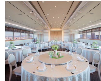
オリオン ORION 14階(231㎡) 収容人数 100名