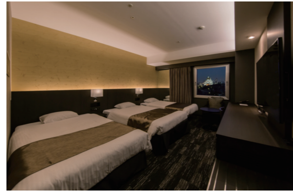
写真はトリプル利用時のイメージです