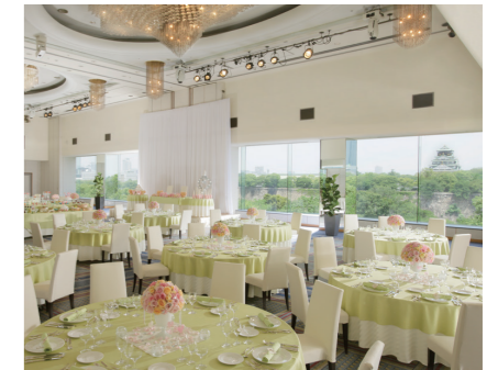
銀河 GINGA 3階(493㎡) 収容人数 240名