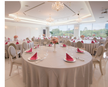
白鳥 HAKUCHO 2階(217㎡) 収容人数 80名

人数に合わせた会場を他にもご用意しております。大阪城が全会場からご覧いただけます。人数によってレストラン個室になる場合もございます。