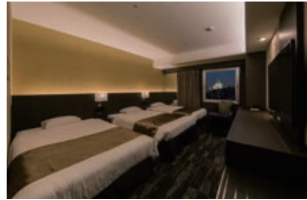
写真はトリプル利用時のイメージです