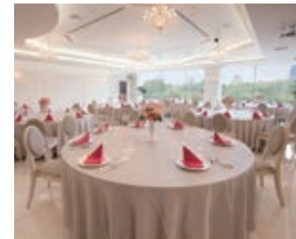
白鳥 HAKUCHO 2階(217㎡) 収容人数 80名

人数に合わせた会場を他にもご用意しております。大阪城が全会場からご覧いただけます。人数によってレストラン個室になる場合もございます。