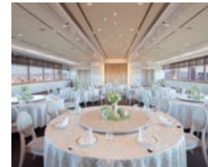
オリオン ORION 14階(231㎡) 収容人数 100名