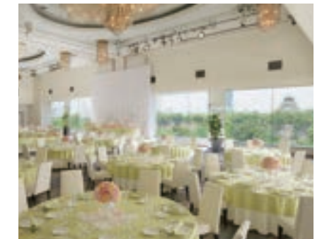
銀河 GINGA 3階(493㎡) 収容人数 240名